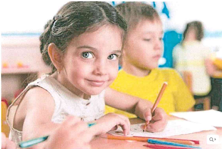
Kinder mit ADHS brauchen Hilfe ihrer Verwandten.