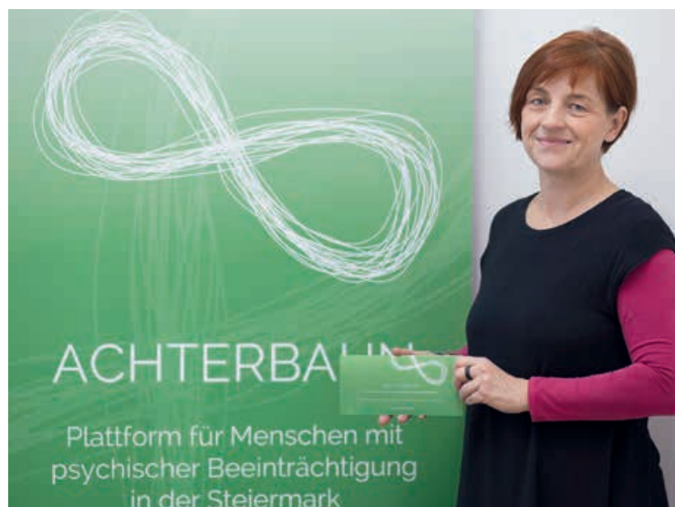
GrafPutz | AK

Der Verein „Hilfe für Angehörige psychisch Erkrankter – Steiermark“ unterstützt Angehörige, damit diese auf ihnen nahestehende psychisch Erkrankte besser eingehen und helfen können. Infos auf www.hpe.at